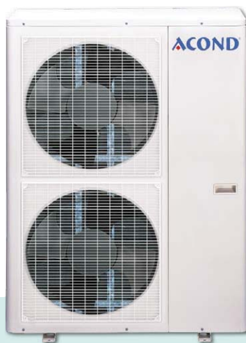
Venkovní jednotka AO-48 a 60 HRN