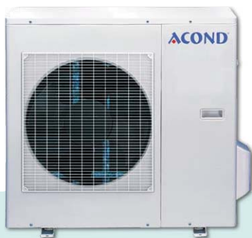
Venkovní jednotka AO-36 HRN